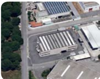
Stabilimento di Fiano Romano (RM)