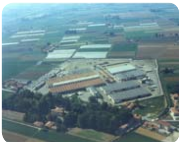
Stabilimento di Bologna

MENARINIBUS - Italia - Autobus. PADANE - Italia - Autobus. - KARSAN - Turchia - Autobus