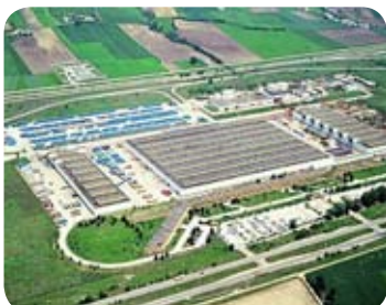
Stabilimento di Flumeri (AV)