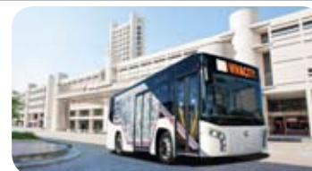
Vivacity 8,00 mt Menarinibus