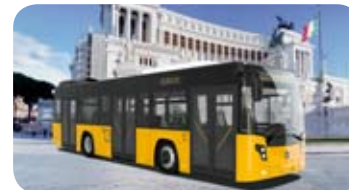
Citymood 10,60 mt Menarinibus