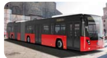
Citymood 18,00 mt Menarinibus