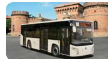
Vivacity 9,50 mt Menarinibus