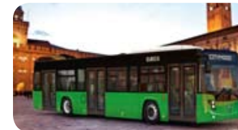
Citymood 12,00 mt Menarinibus